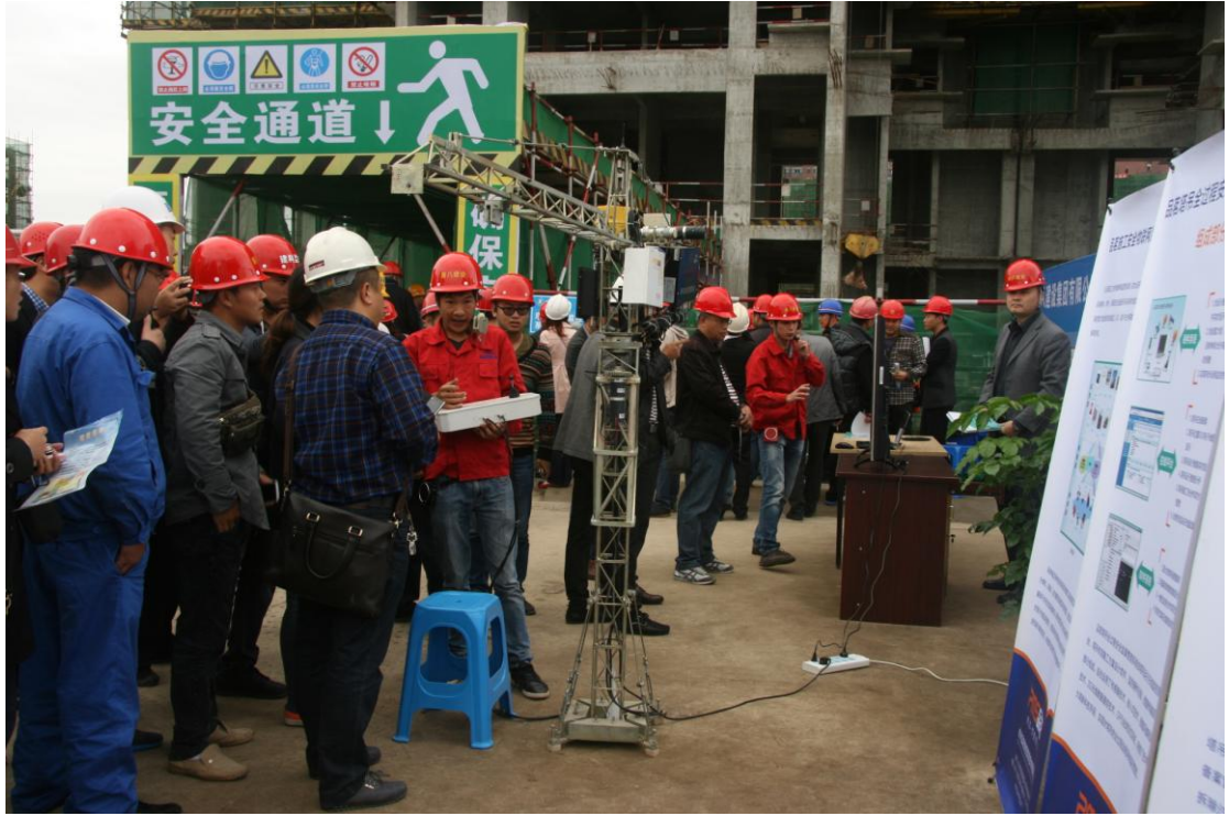
塔吊智能监控系统观摩区