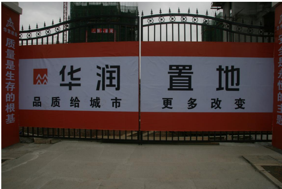
华润置地绵阳中央公园第四期工程项目（观摩会现场入口）

本网消息：10月29日上午，绵阳华润中央公园（D4、D5地块1-5#楼、地下室，建筑面积91477.96m 2 ，-1+34层）项目现场，彩旗飘扬，热闹非凡。来自全市与建筑有关的人员汇聚一起，兴致勃勃地参加了绵阳市住房和城乡建设局召开的第三次建筑工地安全文明施工现场观摩会。