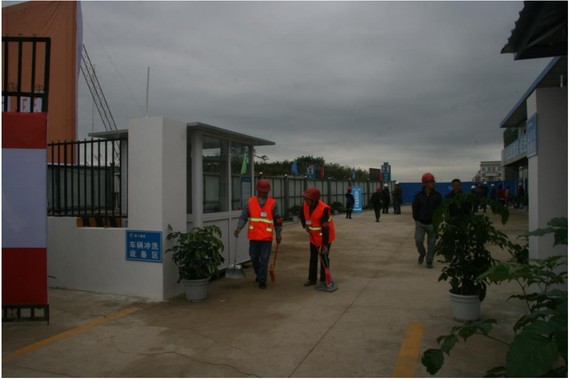
正在工作的工地保洁员