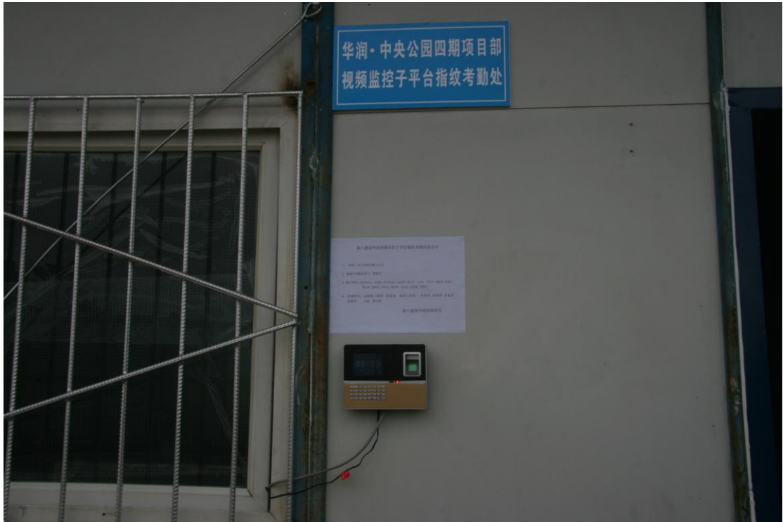
工地实行指纹考勤