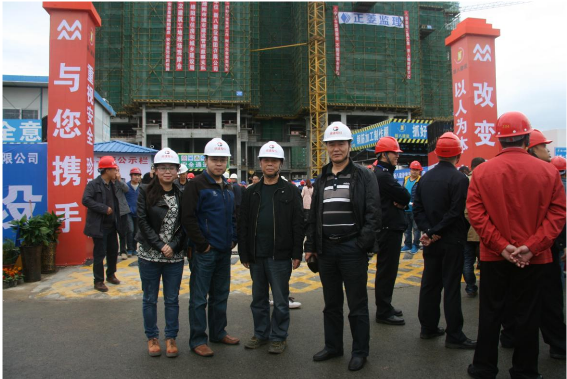
公司部分参观人员

观摩会参观的主要内容是：五方责任主体单位公示牌；视频监控子平台使用情况；塔机智能监控管理系统；悬挑式卸料平台；基础作业面的安全防护及脚手架防护；文明施工（裸露泥土覆盖、大门口冲洗设施、废弃砂浆排污口等扬尘治理措施）。