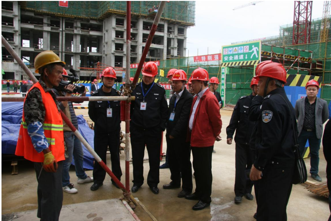
市城建支队人员参观