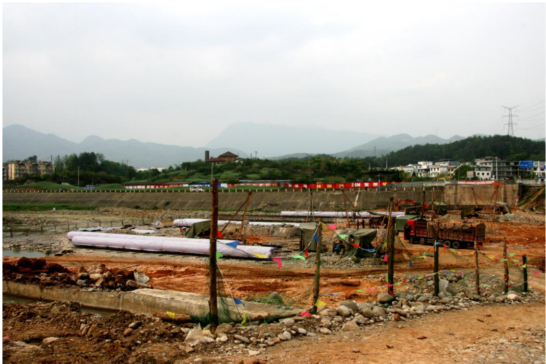
河面，一派繁忙的施工景象