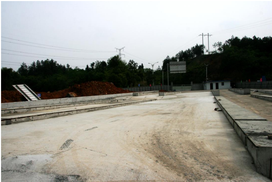
预制构件场地已经浇筑完成

北川安昌桥综合改造工程自去年 11 月启动实施以来，由于该工程为重点工程，市县有关部门非常重视，经常到工地检查督促工作。我公司严格按照桥梁施工规范要求，倒排工期，强化工期节点控制并定期检查进度，狠抓安全文明施工，加大质量监管力度，强化质量关键环节控制，保证了施工任务的顺利进行。